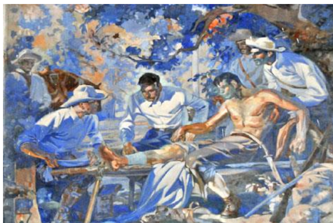
Fig. 3 – Un herido del Ejército Libertador recibe atención médica en la manigua.

Al finalizar la guerra en 1898, con la intervención norteamericana, las tropas españolas fueron evacuadas. Poco después fue desmovilizado el Ejército Libertador, fenece así su cuerpo de Sanidad Militar. (10) En la etapa fundacional de la República, surge con las instituciones armadas, la medicina militar cubana. La sanidad militar contó con la participación de médicos veteranos de las guerras de independencia, que brindaron sus experiencias e impregnaron a la medicina militar del patriotismo de las luchas redentoras. (11,12)