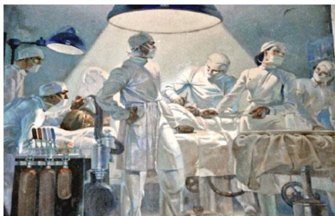
Fig. 5 – Un quirófano con su personal realizando una intervención quirúrgica.

La quinta y última pintura (Fig. 5) hace alusión a este período renovador en la instalación. El artista representó magistralmente un esplendente quirófano, con lámparas luminosas. Los cirujanos, los anestesiistas y las enfermeras instrumentistas, todos ataviados con blanca y reluciente indumentaria de salón, participan en una intervención quirúrgica a un paciente que aparece anestesiado, en decúbito supino sobre la mesa de operaciones. Uno de los cirujanos, bisturí en manos realiza la operación.