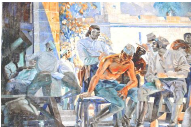
Fig. 2 – Soldados españoles en una instalación médica de una fortaleza.

La segunda pintura (Fig. 2) es una estampa de los militares españoles en una instalación médica en el ámbito de una fortaleza. En el fondo, una torre con aspillera y murallas empedradas, en las que sobresale el penacho de una palma real. Algunos soldados son atendidos por sanitarios y médicos militares. Se observa al negro que junto a las tropas españolas, empezaba a participar en las actividades defensivas de la isla.