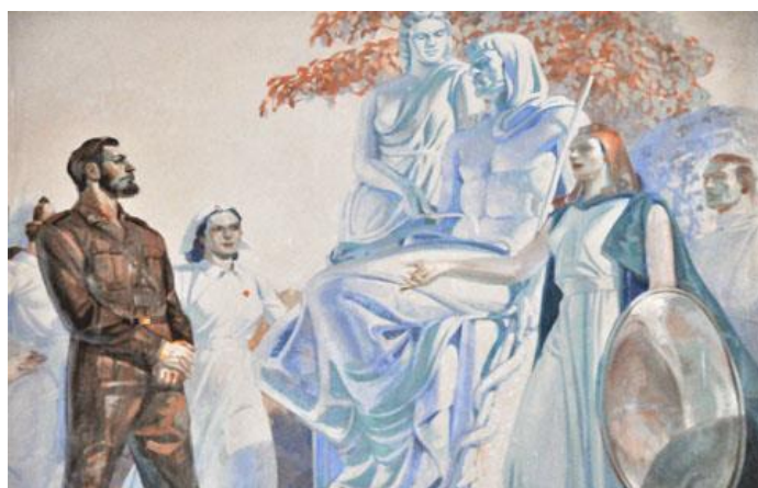
Fig. 4 – Médicos y enfermeras rinden tributo a Esculapio, dios de la Medicina.

En la República, la Sanidad Militar pasó por varias etapas marcadas por contradicciones internas, dadas por el papel del Ejército en el momento histórico en el que se desenvolvía la nación. Sin embargo, hay momentos favorables para la medicina militar y sus logros.